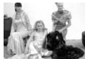
DIE LIVING DOLLS UMKREISTEN WÄHREND DER GESAMTEN MESSE DAS AREAL MARE IN HALLE 15

Bewerbungen nimmt die VDMD-Geschäftsstelle entgegen. Sponsoren waren IGEDO company, Textil-Wirtschaft, mode...information Kramer, Swarovski, ITOCHU und textilfab. Leihgaben für die Ambienten kamen von JAB Anstoetz, Berde, ASA, EINS ZWEI DREI, Moch Figuren, evbgk und Impressionen. Ihnen allen gilt unser Dank!