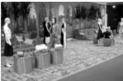
PALAZZO-INSZENIERUNG AUF DER CPD

Noch bis zum Februar 2005 war der VDMD-Stand auf den Düsseldorfer Modemessen ein Lückenbüßer in Standardbauweise. Doch bereits im Juli 2005 gab es das über 100 m 2 große VDMD-Jubiläums-Areal. Doch das war nur die Aufwärmphase, denn im Februar 2006 erregte der VDMD mit seiner schwarz-weißen Gestaltung des gesamten (!) Nordeingangs sowie mit dem rund 180 m 2 großen doppelten Schachbretts mit Mode ausgewählter VDMD-Designer für