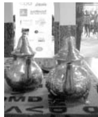
DER VDMD-STAND IM EINGANG NORD – TEPPICHDESIGN: GABRIELA KAISER