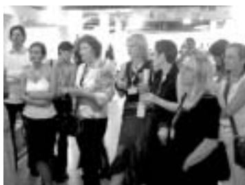
DESIGNER UND BRANCHENFREUNDE NUTZEN DIE HAPPY HOUR DES VDMD AM SONNTAG ALS TREFFPUNKT