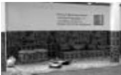
PIAZZA-INSZENIERUNG IM NORDEINGANG DER MESSE DÜSSELDORF