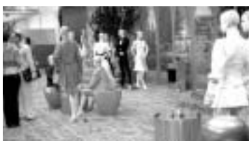
DAS TRENDAMBIENTE PALAZZO IN HALLE 14