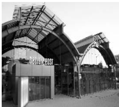
DESIGN POST KÖLN

In die Design Post Köln hatte der VDMD Designer, Industrie und Handel am 29. April 2006 eingeladen – weit über 60 Teilnehmer kamen an diesem Samstag aus ganz Deutschland angereist, um Neues zu Design-