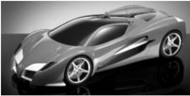
CONCEPT-CAR MODELL ASCARI